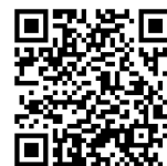
衛保組學生保險款QR CODE