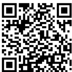
學生團保申請理賠流程圖 QR code

一、學生團體保險收件時間更改為每週二下午3點至晚上7點由三商美邦人壽駐校服務人員於衛保組內辦理理賠申請，相關申請注意事項及保險計畫內容，請參閱本組網頁。【寒、暑假期間收件時間為每週二下午1-3點】。因應新冠肺炎疫情，配合政府警戒標準執行業務，服務時間如有更改，將公告於學務處衛生保健一組網站，師生如有任何學保相關問題請上網站查詢或來電衛保組詢問。